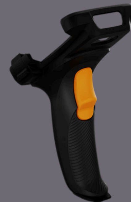
Gatilho para R2