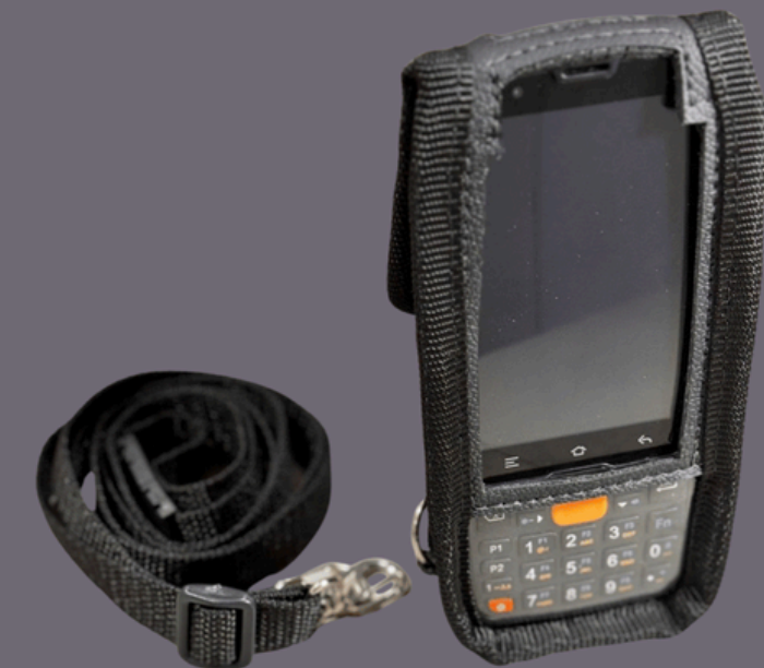
Capa de proteção em couro com alça de ombro