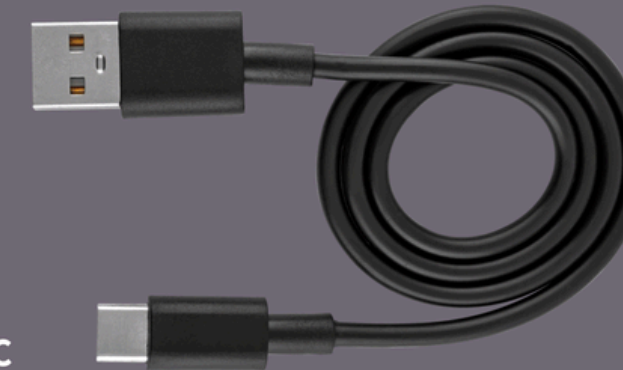
Cabo USB-C para carregamento