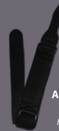
Alça para mão Hand-Strap