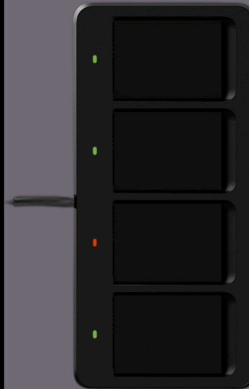
Carregador de 4 posições